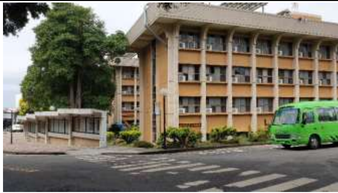
靜宜大學主顧聖母堂站