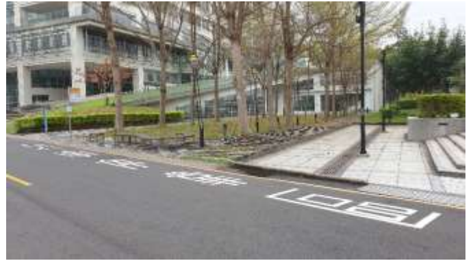
靜宜大學主顧樓站